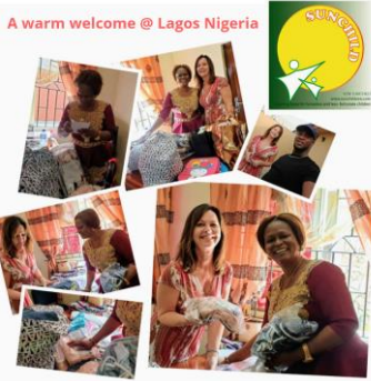
A warm welcome @ Lagos Nigeria